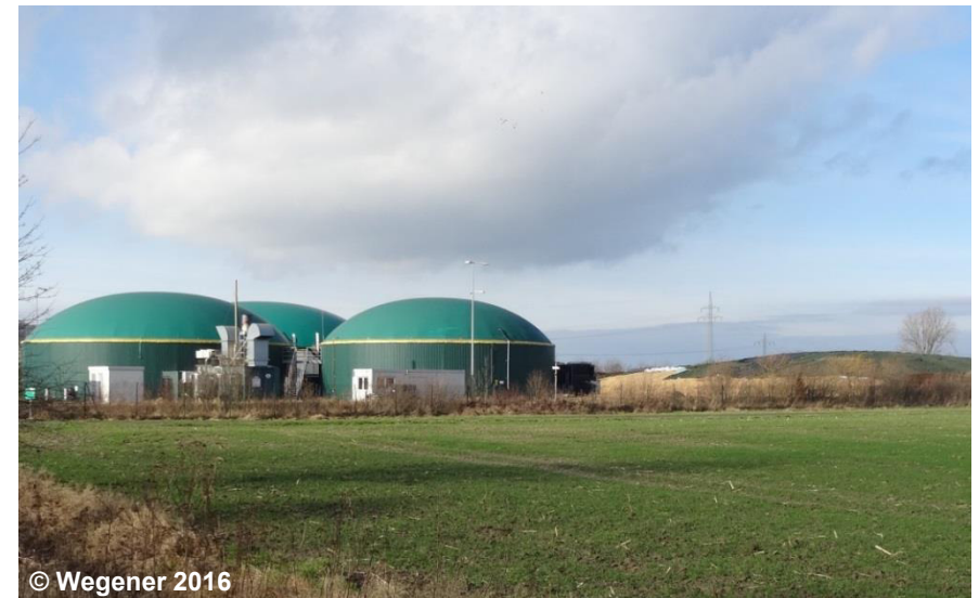
Blick auf die Biogasanlage