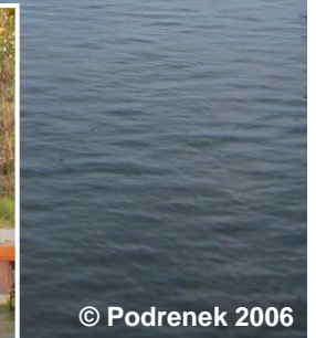
Blick auf die Spundwand