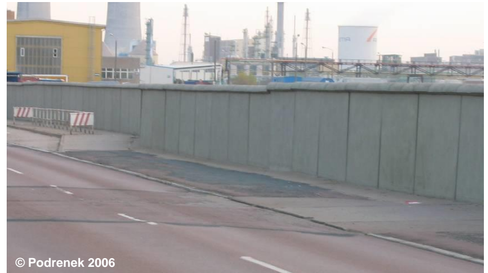
Beispiel für eine Mauer