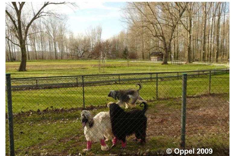
Blick auf 'Rennbahn, Laufbahn, Geläuf' (Hunderennsport)

SPO 1115 Hunderennsport BWF 1420 Rennbahn, Laufbahn, Geläuf (G) NAM Hunderennbahn Tüttleben BRO 10