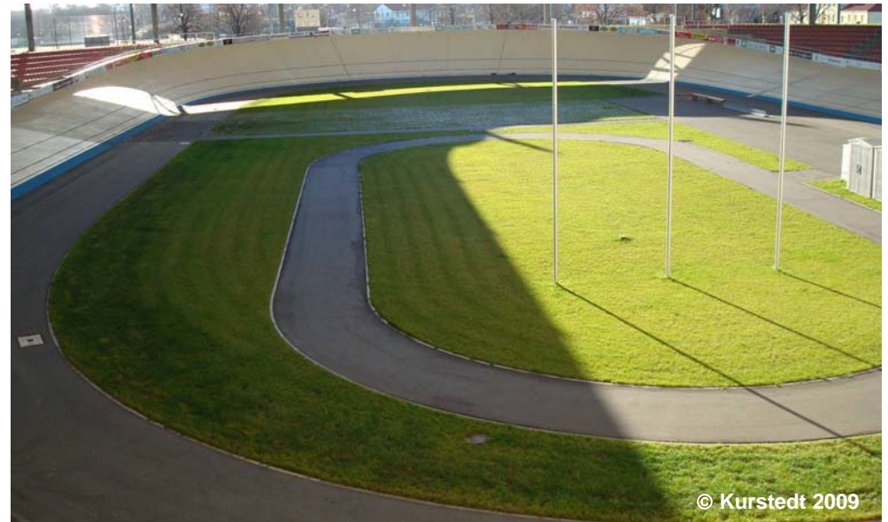
Beispiel für 'Rennbahn, Laufbahn, Geläuf' (Radsport)