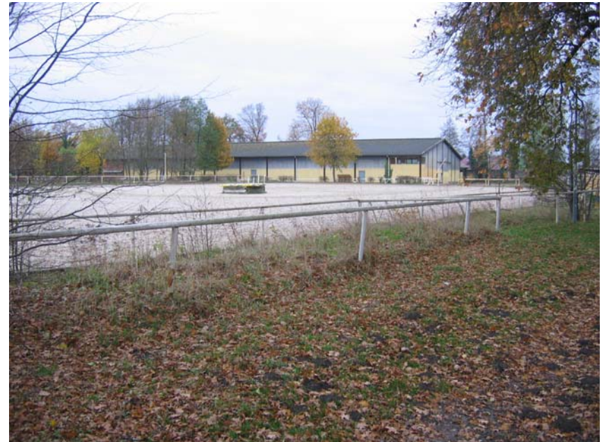
Blick auf das Spielfeld 'Reiten'