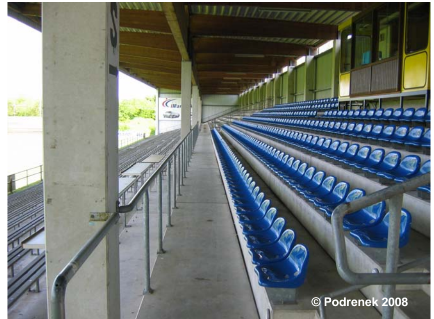
Blick auf die Zuschauertribüne