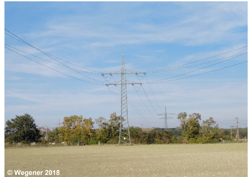
Beispiel für eine Freileitung