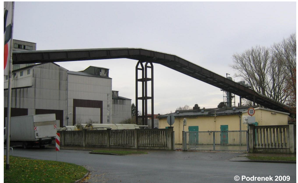
Blick auf 'Förderband, Bandstraße'