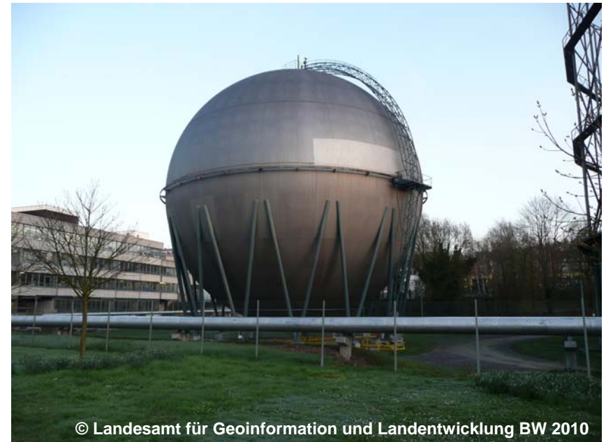
Blick auf den aufgeständerten Gastank

OFL 1400 Aufgeständert BWF 1205 Tank HHO .... SPE 1120 Gas