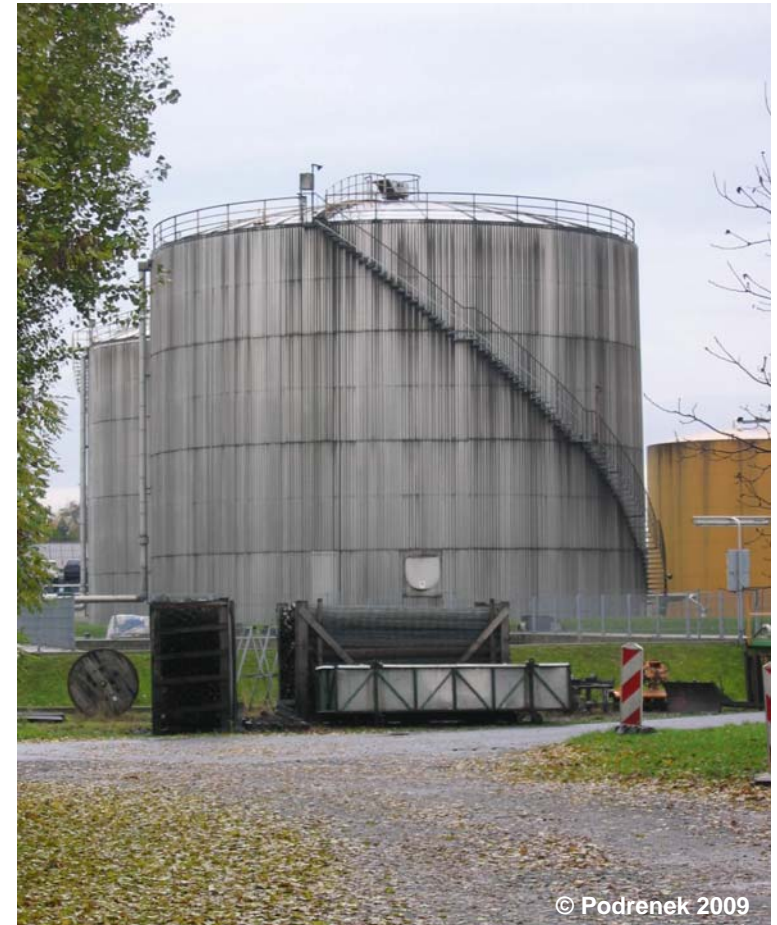
Blick auf die Tanks