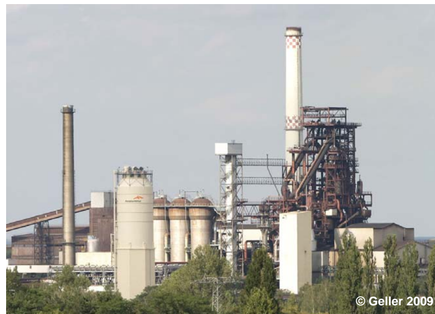
Blick auf den Hochofen