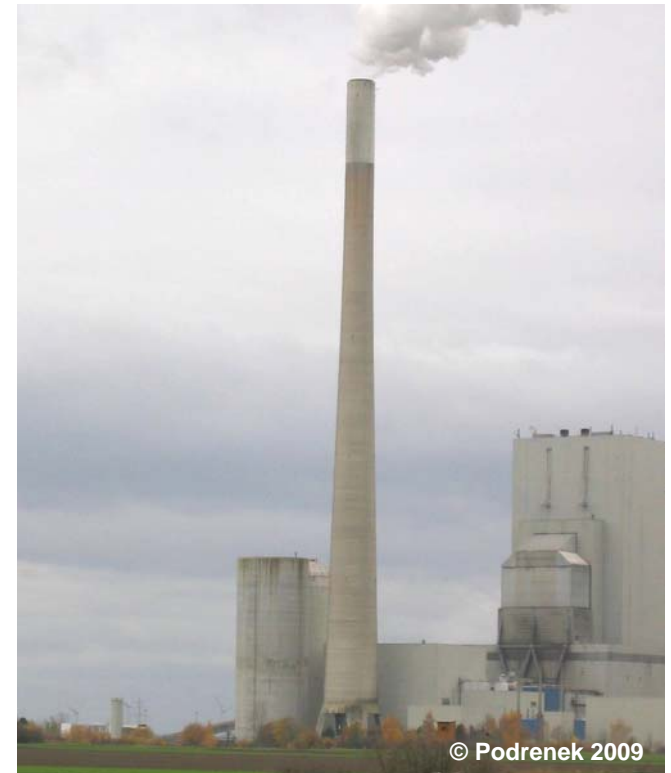
Blick auf den Schornstein

BWF 1290 Schornstein, Schlot, Esse (G) HHO 250