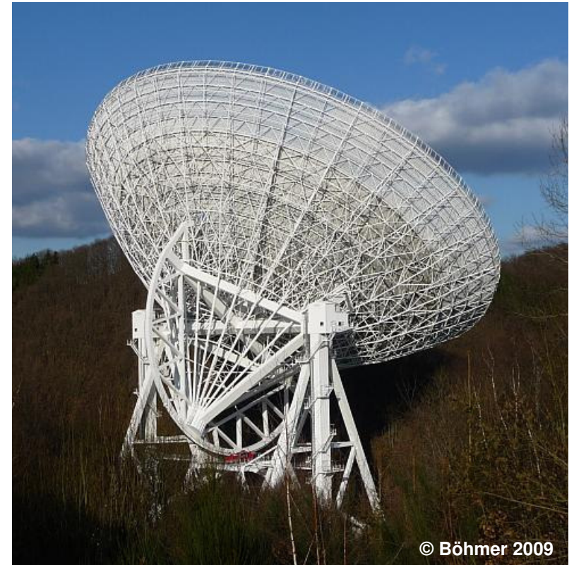
Blick auf das Radioteleskop