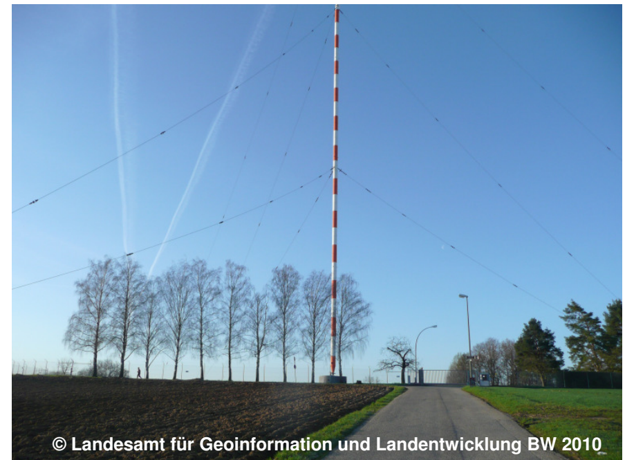
Blick auf die Antenne