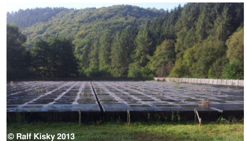
Blick auf eine LOFAR-Station (High-Band)