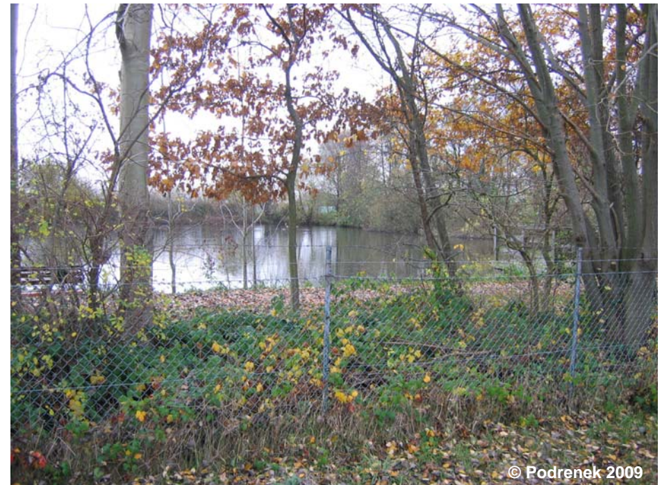
Blick auf das Klärbecken