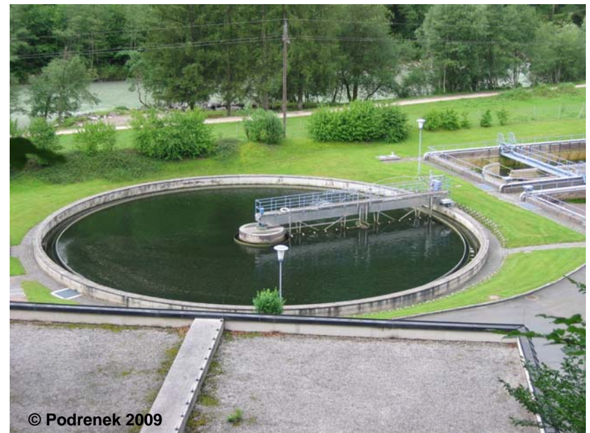
Beispiel für ein Klärbecken