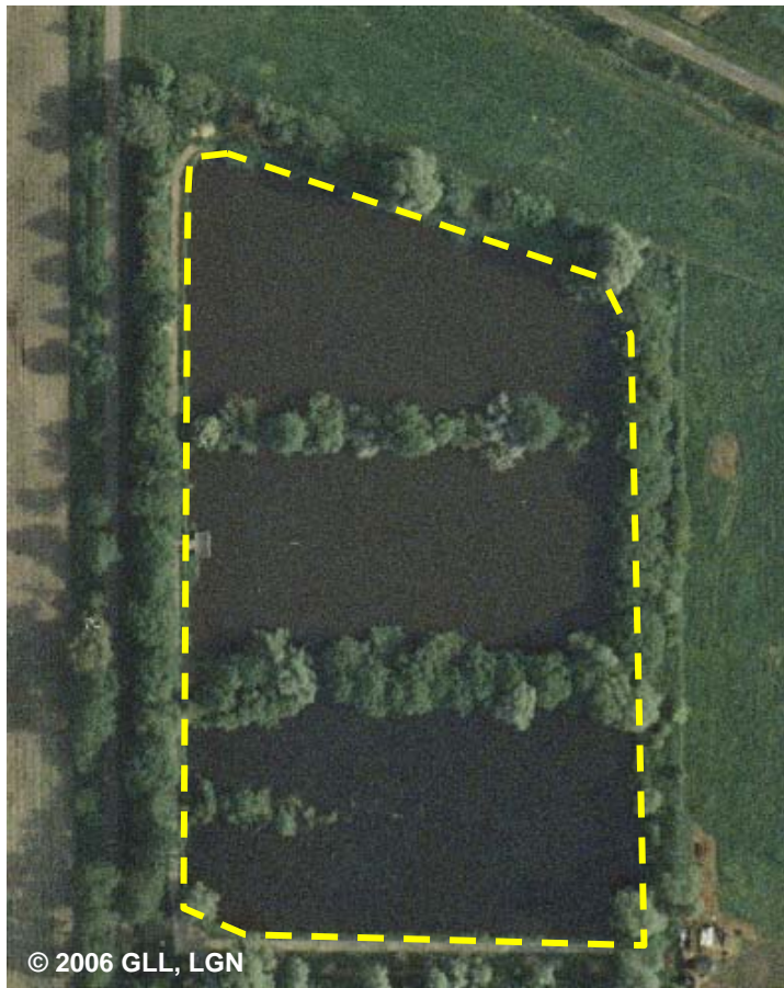
BWF 1210 Klärbecken (G)

Erfassungskriterium: vollzählig außerhalb von Industrie- und Gewerbefläche mit FKT 2610 sonst \geq 0,1 ha.