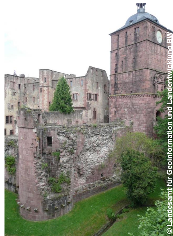
Blick auf den zerstörten Turm