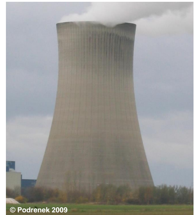
Blick auf den Kühlturm