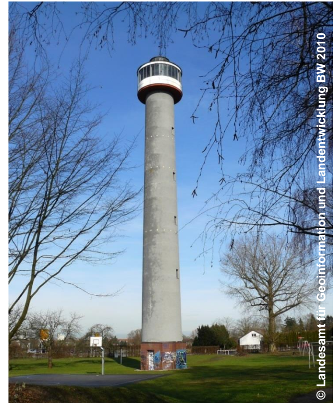
Blick auf den Turm ohne Funktion