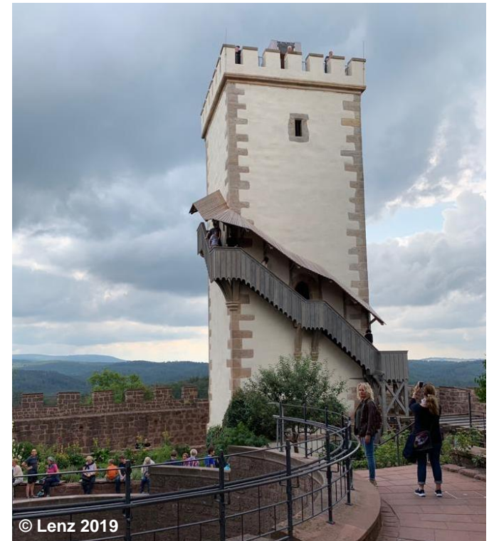
Blick auf den Burgturm