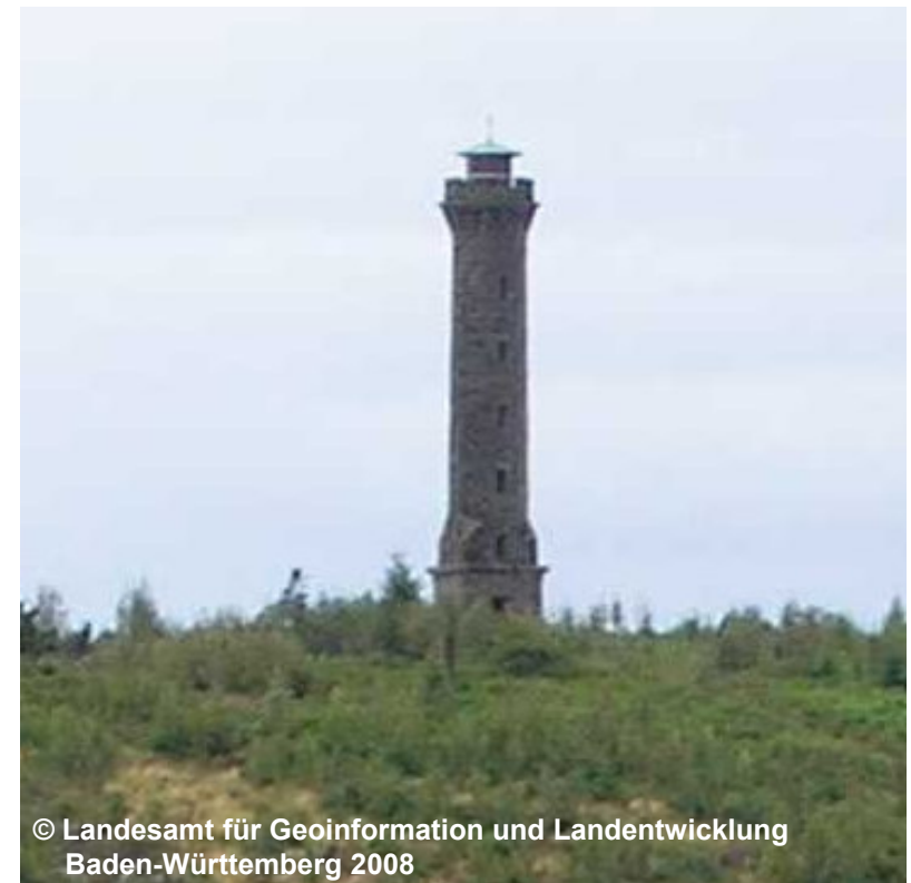
Blick auf den Mooskopfturm