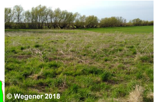
Blick auf das Brachland