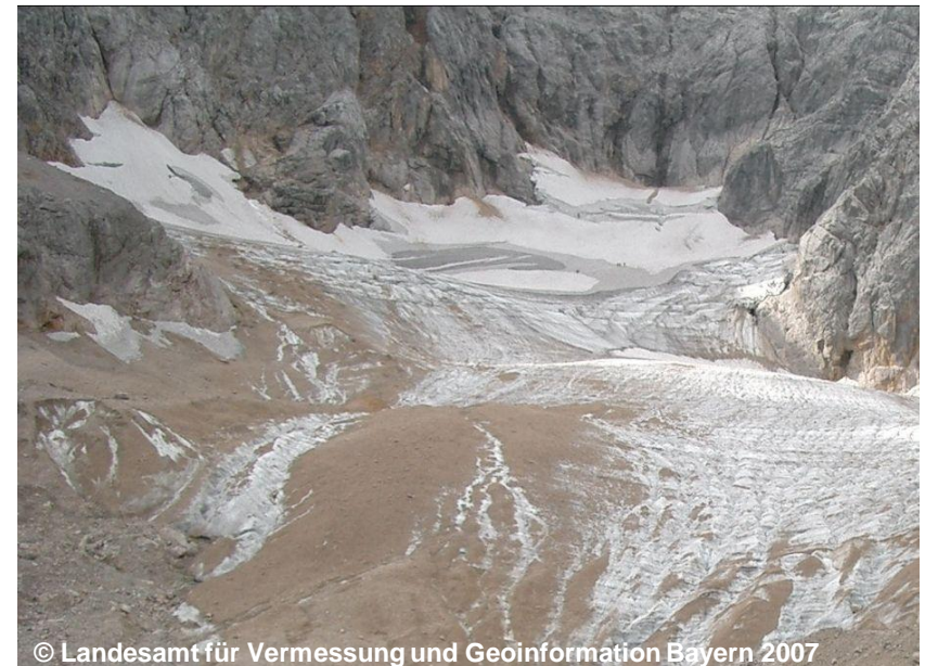
© Landesamt für Vermessung und Geoinformation Bayern 2007

FKT 1000 Vegetationslose Fläche (G) OFM 1120 Eis, Firn (G)