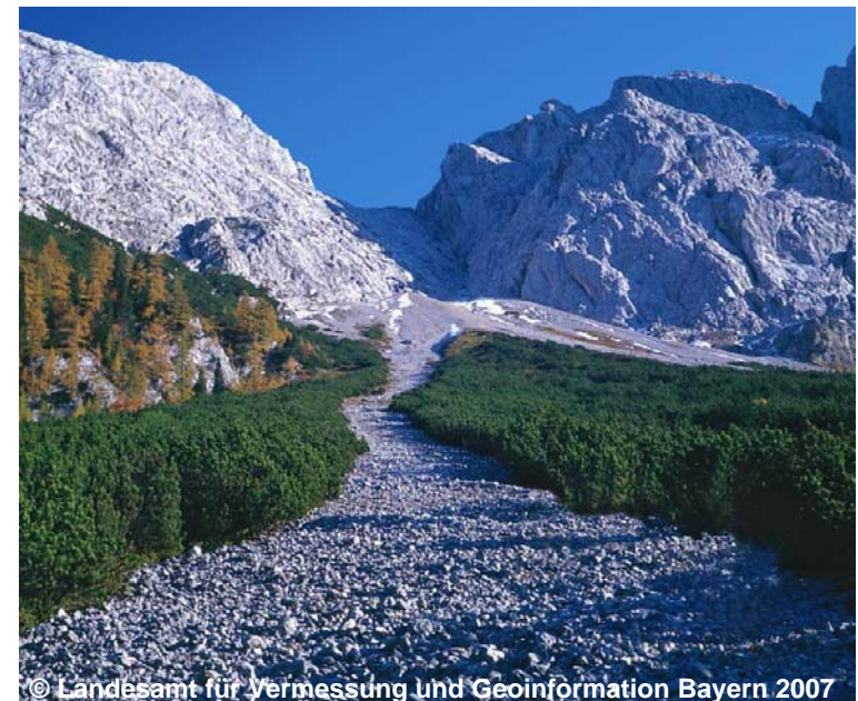
Beispiel für eine vegetationslose Fläche mit Geröll

FKT 1000 Vegetationslose Fläche (G) OFM 1030 Geröll (G)