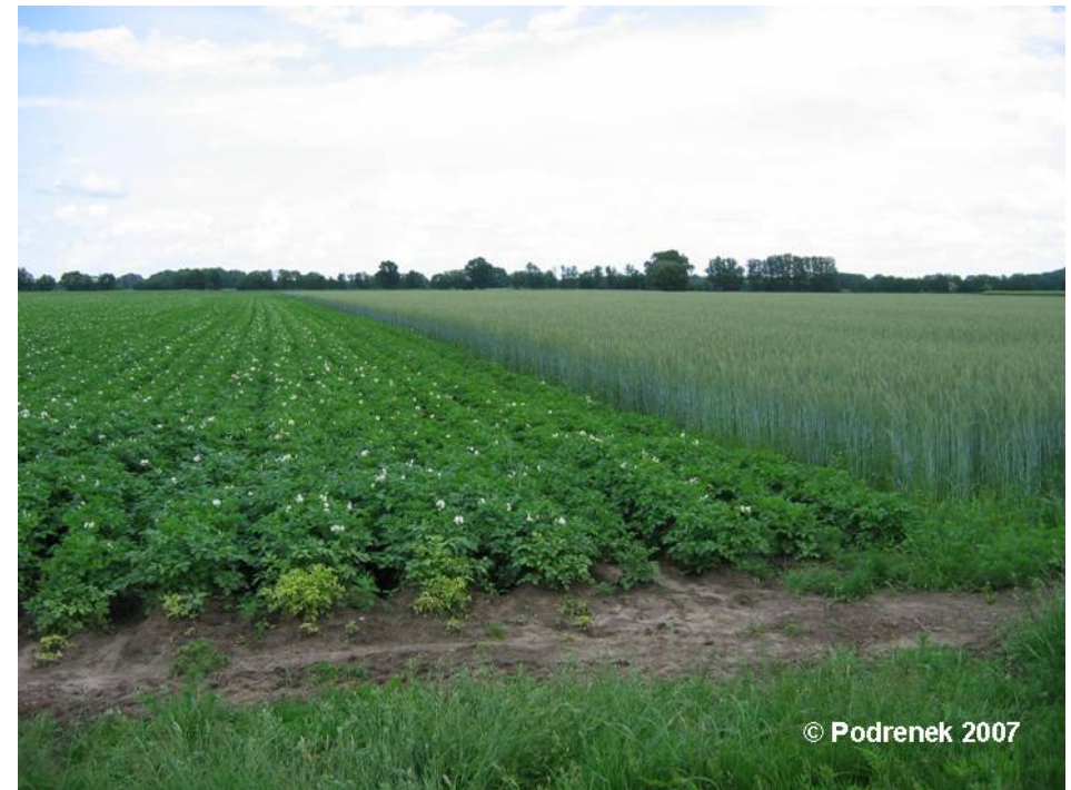
Beispiel für ein Ackerland