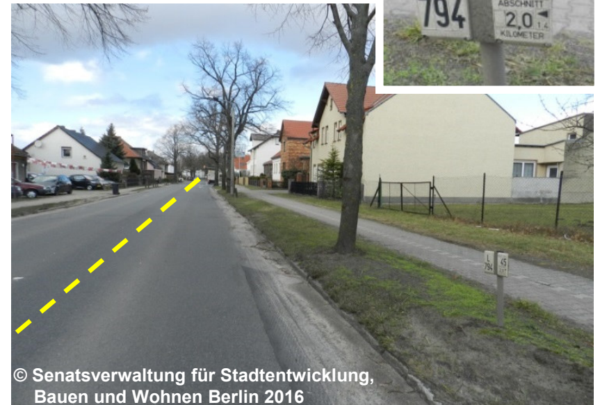
Blick auf die Landesstraße