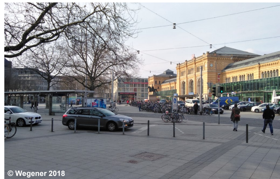
Blick auf den Platz

NAM Ernst-August-Platz (G) STS 0324100100841 (G) ZNM Bahnhofsvorplatz FKT 5130 Fußgängerzone (G)