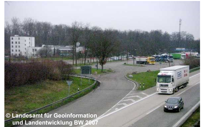
Blick auf die Raststätte

Wenn bei unidirektionalen Auf- und Abfahrten sowie bei Fahrgassen innerhalb von Raststätte tatsächlich nur ein Fahrstreifen vorhanden ist, wird beim Objekt 42003 AX_Strassenachse das Attribut FSZ mit dem Wert 1 belegt.