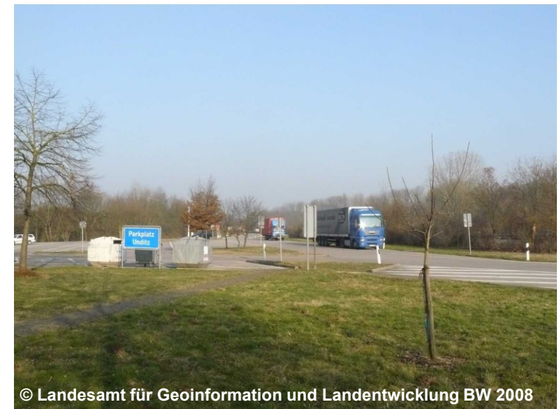
Blick auf den Rastplatz