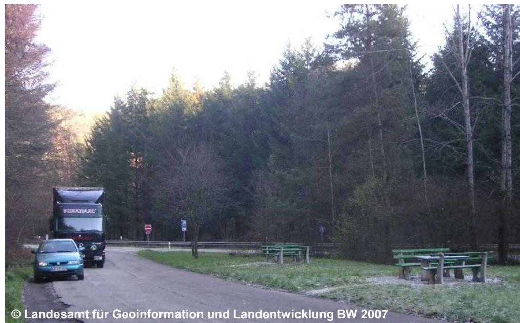
Blick auf den Rastplatz an der B492