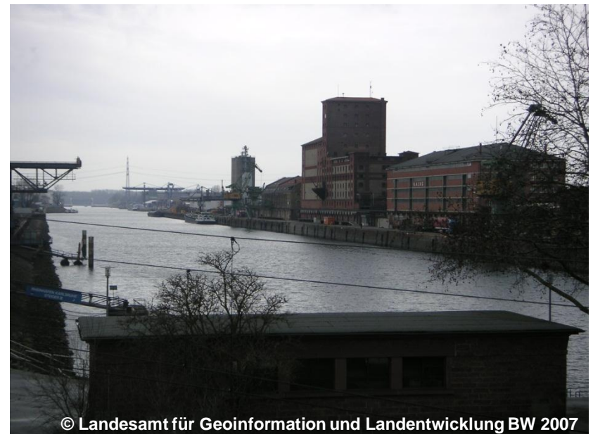
Blick auf die Hafenanlage (Landfläche)