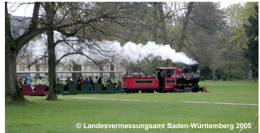
Blick auf die Bahn im Freizeitpark