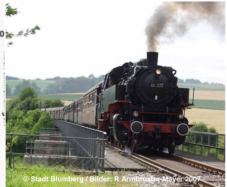
Blick auf die Museumsbahn