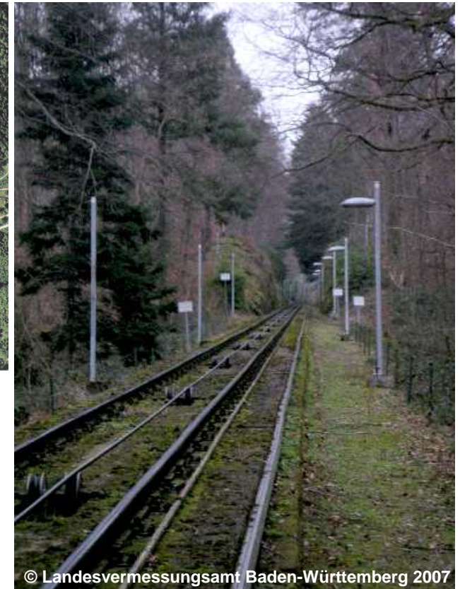
Blick auf die Standseilbahn

BKT 1302 Standseilbahn (G) ELK 1000 Elektrifiziert (G) GLS 1000 Eingleisig (G) NRB .... (G) NAM Merkurbahn ZNM .... SPW 2000 Schmalspur (G)