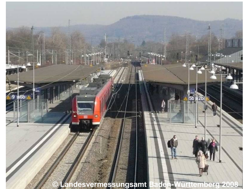
Blick auf die S-Bahn