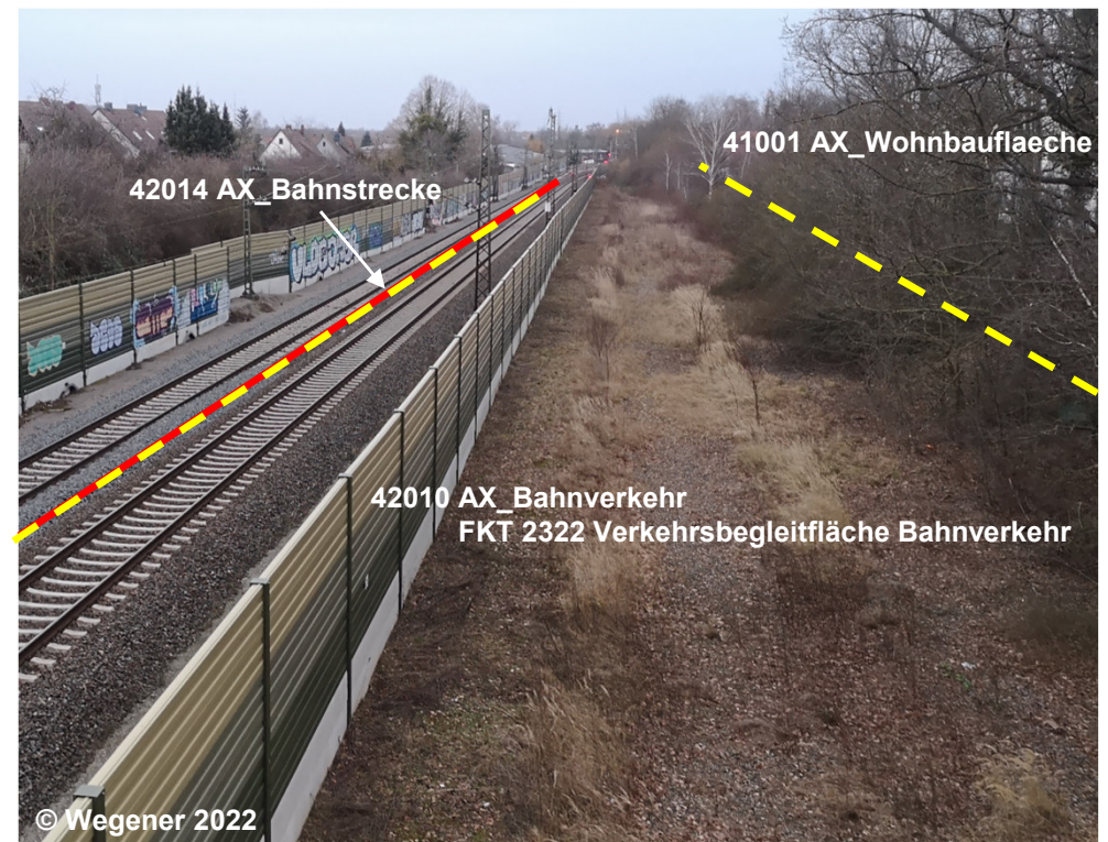
Blick auf die Verkehrsbegleitfläche Bahnverkehr