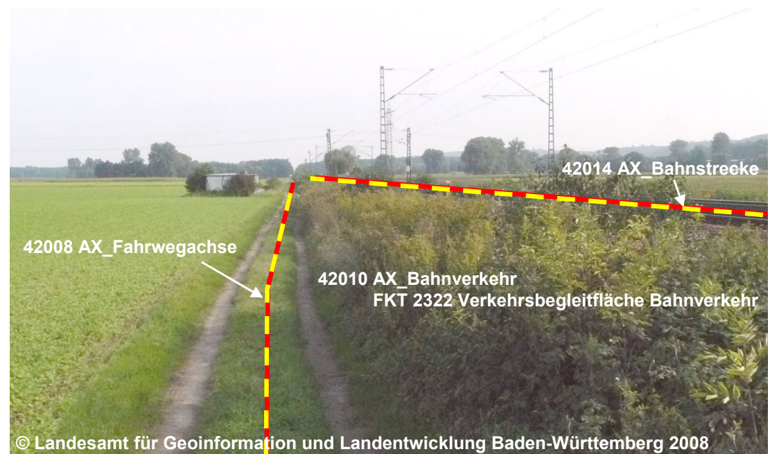
Blick auf eine Verkehrsbegleitfläche Bahnverkehr