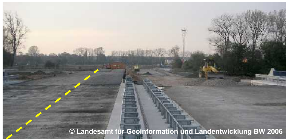
Blick auf die Fahrbahn im Bau

ZUS 4000 Im Bau (G) BFS .... BRF 7 (G) FSZ 2 (G) OFM 1230 Bitumen, Asphalt