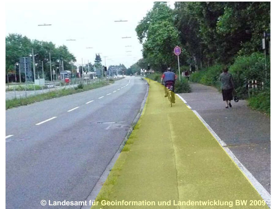
Blick auf die Fahrbahn mit begleitendem Radweg

BFS 1000 Mit Radweg BRF 12 (G) FSZ 2 (G) OFM 1230 Bitumen, Asphalt