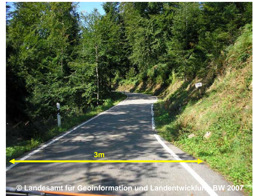
Blick auf die Breite der Fahrbahn