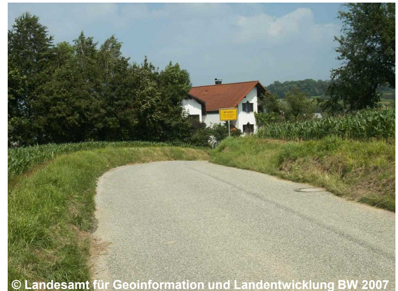
Blick auf die Straße mit zwischenörtlichem Verkehr