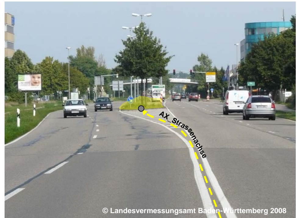
Blick auf die Straße mit beginnender Fahrbahntrennung