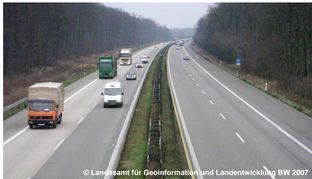
Blick auf die Straße mit Fahrbahntrennung

FTR 2000 Getrennt (G) IBD 2001 Europastraße (G) BEZ A5 (G) BEZ E35 (G) NAM .... (G) WDM 1301 Bundesautobahn (G) STS .... (G) ZNM Rheintalautobahn