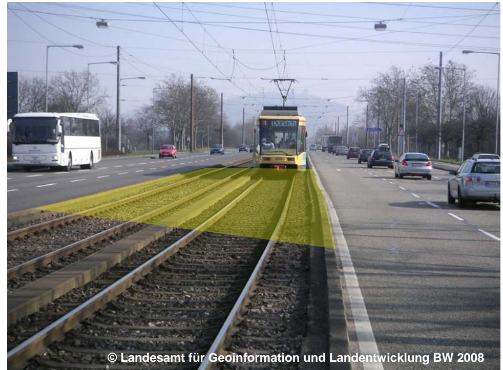
Blick auf die Straße mit Fahrbahntrennung