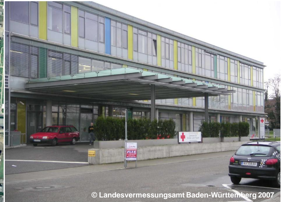
Blick auf die Fläche Gesundheit, Kur