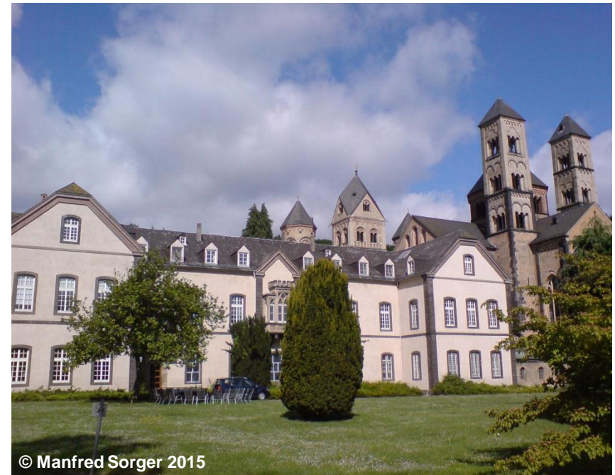
Blick auf die Religiöse Einrichtung

FKT 1140 Religiöse Einrichtung BEB 1000 Offen (G) NAM Maria Laach