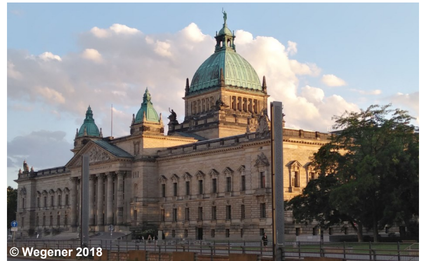
Blick auf die Fläche mit der Funktion Verwaltung