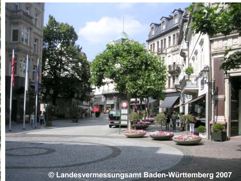
Blick auf die Fläche gemischter Nutzung im städtischen Bereich