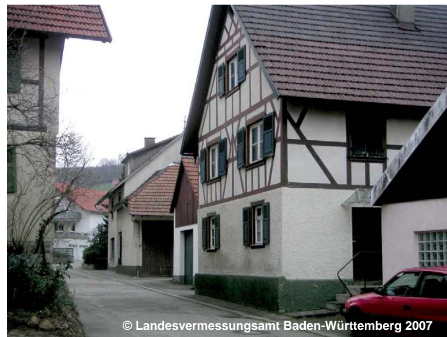
Blick auf die Fläche gemischter Nutzung im ländlichen Bereich