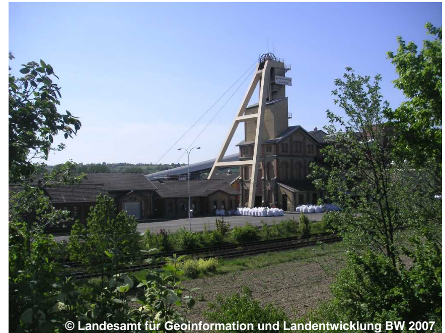
Blick auf den Bergbaubetrieb

AGT 5003 Steinsalz NAM Steinsalzbergwerk Kochendorf BEZ 125005-011 GT