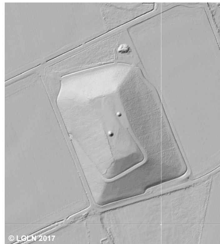
Beispiel für eine ehemalige Halde mit aufgeforstetem Bereich