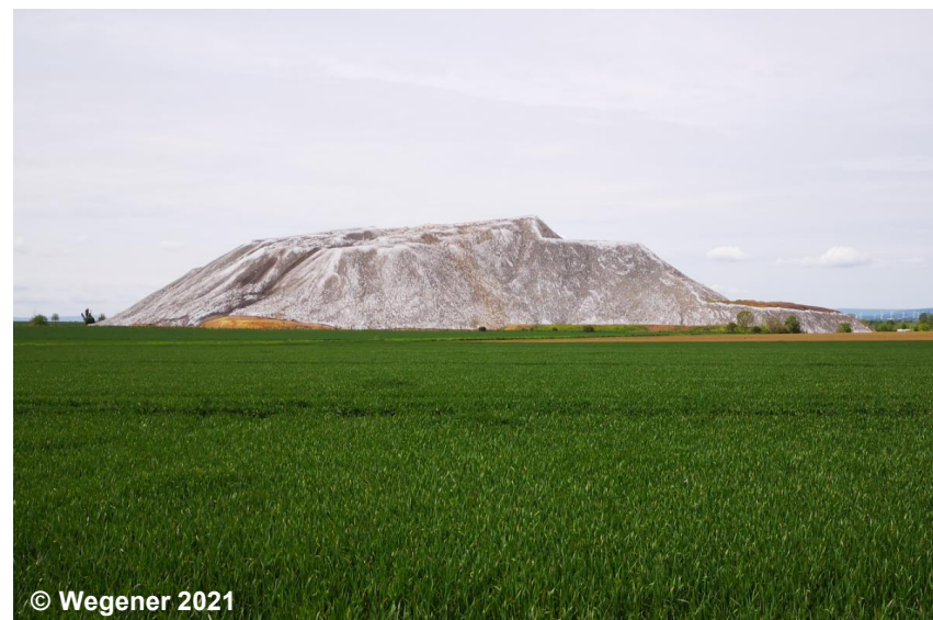
Blick auf die Kalihalde