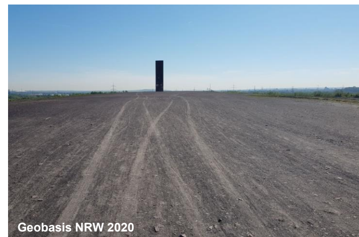
Blick auf die Haldenkuppe