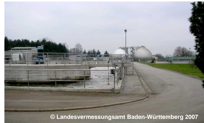
Blick auf die Kläranlage