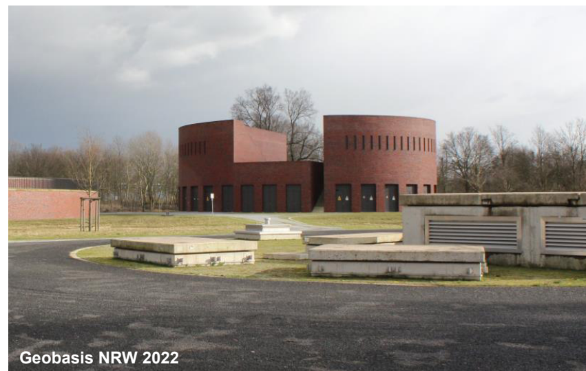
Blick auf das Pumpwerk