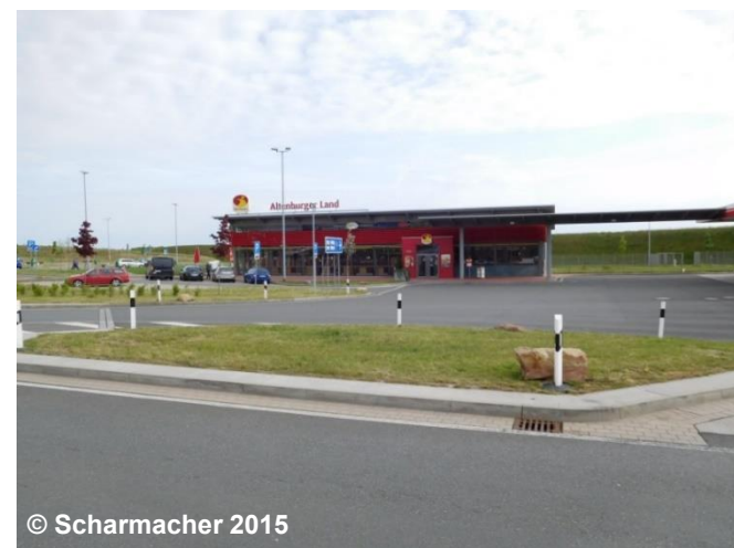
Blick auf die Raststätte

ZNM Altenburger Land Nord FKT 5330 Raststätte, Autohof (G) NAM Altenburger Land (G) RGS .... STS .... (G)