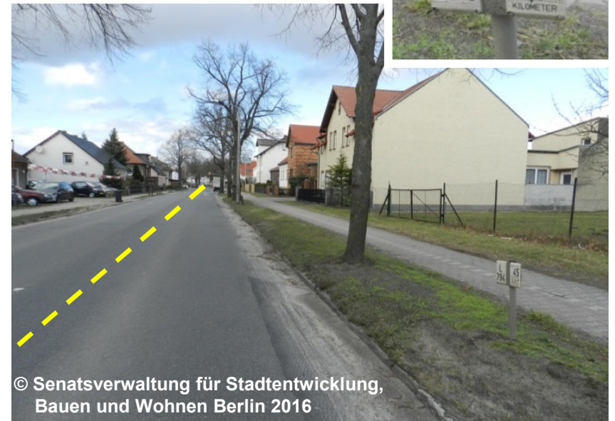
Blick auf die Landesstraße